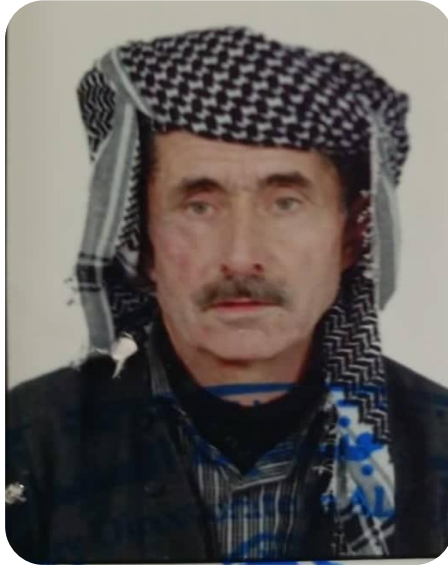
سهعید حه مه بۆر میرزا رۆسته می