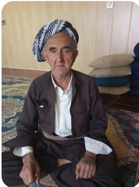
محمه دي مهلا محمه ده مينی