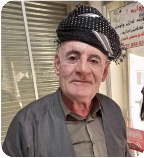
حه مه ده مين مام حمد قادراوايي