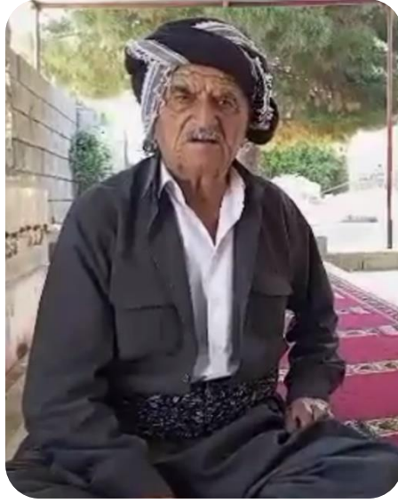
مام تالی قوچالی سهرگه ینیلی