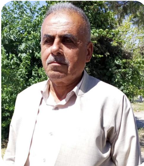
عه بدوللا باپير سه رگه يني لي