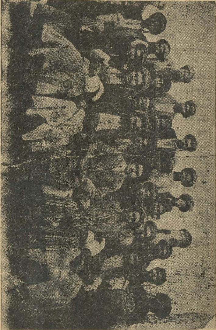
نيگارى بەشېك لە قوتايىنى زانستى سالى ۱۹۲۸