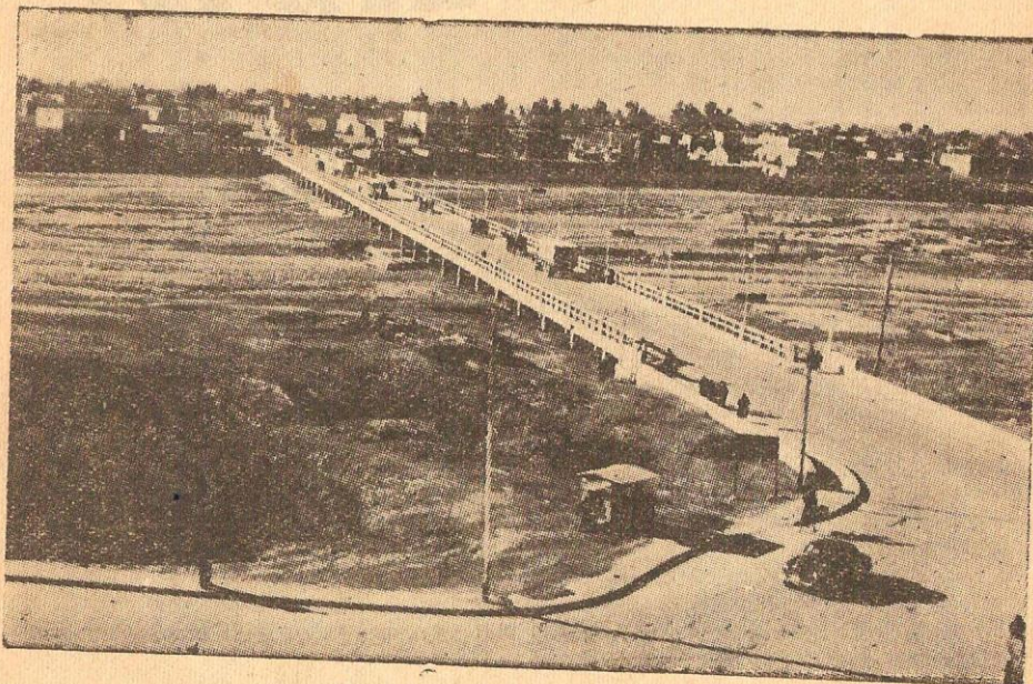
دیمه نیکی شاری كه ركوك

له گه شته كه يا باسي ميژوي ئەم شارە ئەكات ئەلێ :- له سالی « ٦٥٦ » ی كۆچی دا كه هه لاكو پهلاماری شاری بهغدای داوه له دواي كشانه وهی له و تور كمان و مهغولانهی له سوپا كه یا بووه تییکی له وانه بو به رهه لستی کردنی ئازاوه و هه را له كه ركوك هیشته وه وه له ویدا نیشته جی بوون ئەم شارە له ئەندازە ی زه دیاوه ٣٤١ مەتر بهرزتره سه سه ژماره ی ناوشاره كه ٧٨٥٥٤ و هی گشت لیوا كه ٣١٤٦٠٥ كه سه پانایی زه وی هه مو لوا ٣٧٦ ر ٢٠ کیلومه تره ی چوار گوشه یی به .