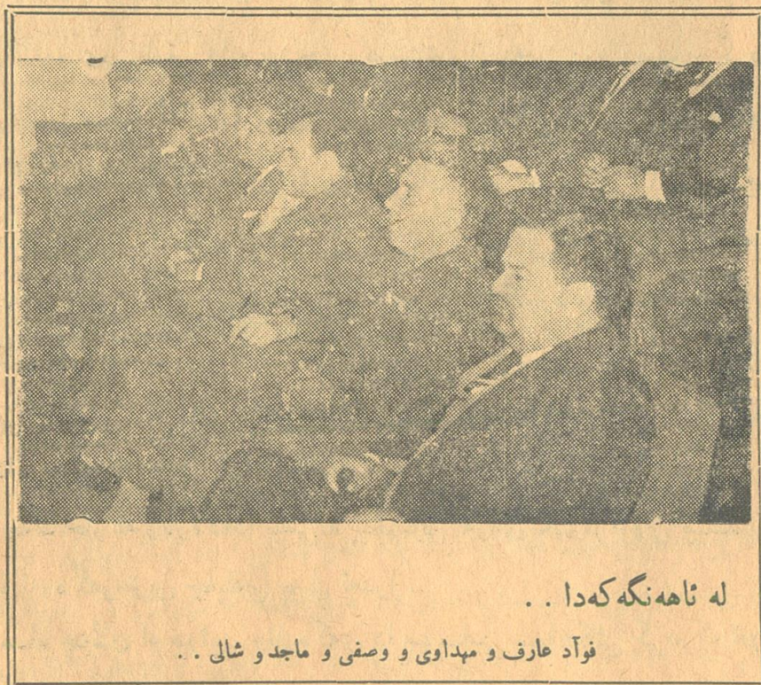
له ئاههنگه که دا . .

پارتی دیموکراتی کوردستان هه موو سالیک له یادی نهوروزا ئاههنگی گیراوه ، چ به نهینی و چ به ئاشکرا ، نه مسالیش - وهك سالانی تری پاش شورش - خوی ئاماده کرد بو گیرانی ئاههنگیکی وا به جوش که شایانی یادی ئهم شورشه پیروزه میژوویی بهمان بیت و بگونجی له گهل ههست و هیوای نه تهوهی کورد لهم کاته دا .