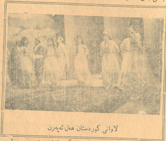
لاوانی کوردستان ههل ئه پهرن