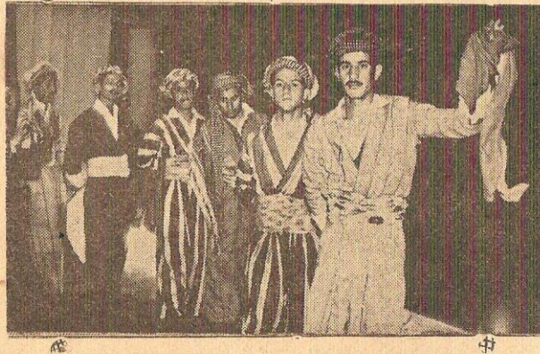
هەلپەر کئی کوردی

ئەم پیاوێ زور ریزی هەژارانێ ئەگرت وە یاریدە ی ئەدان سەرەرای هەژاری خوی زور جار ئاوازی هەژاری بو لی ئەدان وە هانی ئەدان بو یەك گرتن و زال بون بەسەر زوردارانا وە هیرشی ئەبرده ســـــــــەر کار بە دەستانی نەمساو دەولەمەندە خوین مژە کانی ئەوەی ترس بی لەدلی ئەم هونەر مەندەدا نەبوو • خوی پیاویکی دلسو کو خوشەو یست بو لای گەلە کە ی وە هەستی نیشتمان پەرورەری زور بەرز بوو لـــــــــەم روو وە ئە ی ووت « کەسیک بو نیشتمانی خوی خەبات نە کات ناپەسندو نالە بارە وە لەم نیشتمانە نیە » • هەستی نیشتمانیه تیو مرو قایه تی بە خوین دائە نا ئە ی ووت :- « لە دلە وە دەر ئە چی ئە بی لە پێشە وە دە ورو یشتی دل بە خوین ئاو و بدات ئە و جا بو پارچە کانی کە ی لەش هەول بدات » • خوی دلی بە نیشتمان داناو وە پارچە کانی کە ی لەشی بە گەلانی تر داناو وە •