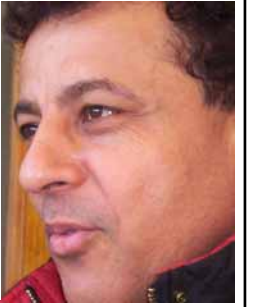
مریوان رویا قانع دهینوسیت