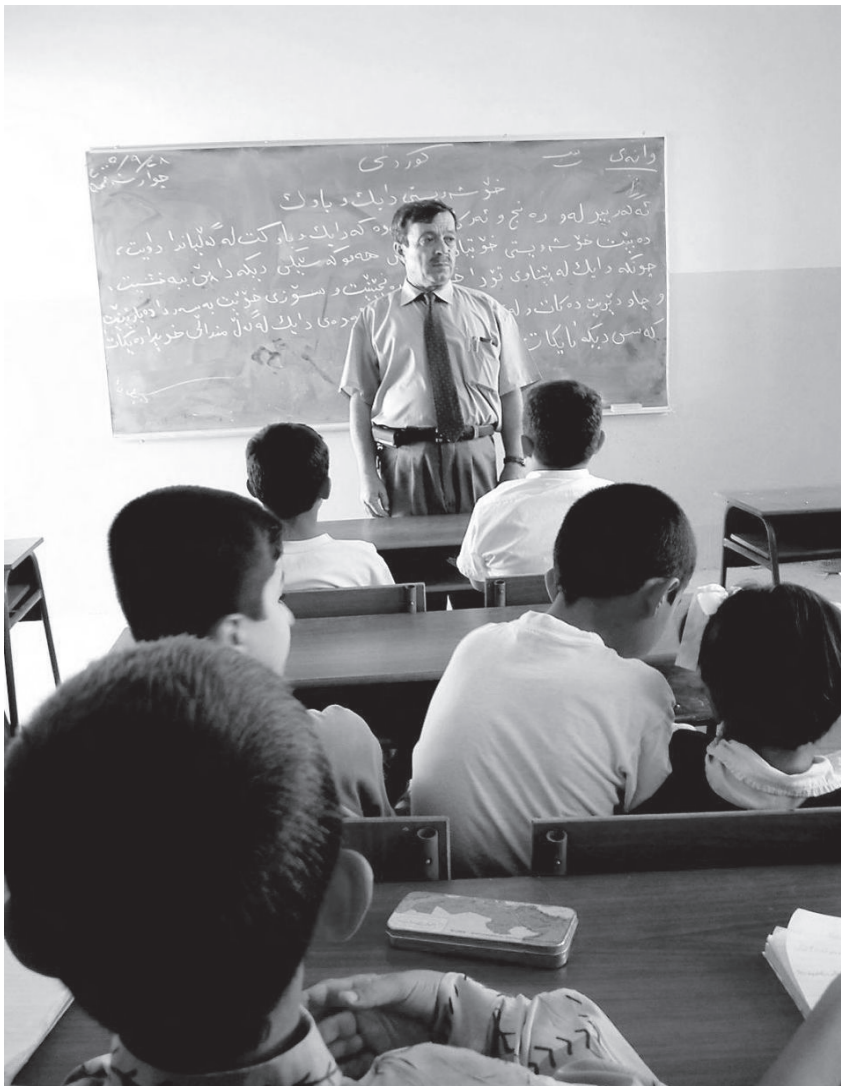
کاتی وانه‌وتنه‌وه له پۆلیکی کوردستاندا

به‌لام له به‌ره‌مه‌یتانیدا قوتابییان و مامۆستایان به‌شداری تیدا ده‌کهن. به‌شی سه‌ره‌کیی به‌نامه‌که بریتییبه له‌و ئامانجانیه‌ی که قوتابخانه‌که ده‌یه‌ویت له‌و ساله‌دا پپی بگات. ده‌بیت به‌وردی له به‌نامه‌که‌دا باس له‌وه بکریت که چۆن قوتابخانه‌که بۆ گه‌یشتن به‌و ئامانجانه کار ده‌کات. له‌ کۆتایی سالدا به‌نامه‌که هه‌لده‌سه‌نگینریت و لایه‌نی به‌هیز و لاوازی کاره‌کان ده‌ستنیشان ده‌کریت.