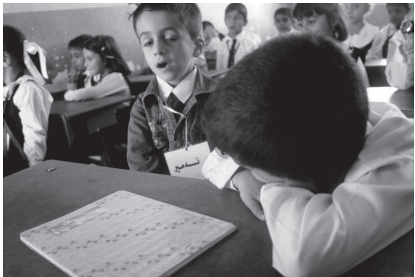
چه‌ند خویندکاریک له‌ پۆلدا - کوردستان