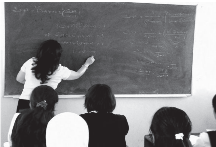
مامۆستایه‌ک له کاتی وانه‌وتنه‌وه‌دا - کوردستان

له کارکردن و یاساکانی سه‌ر شه‌قام که زۆر دوورن له په‌یوه‌ندییه‌کانی ناو قوتابخانه‌وه.