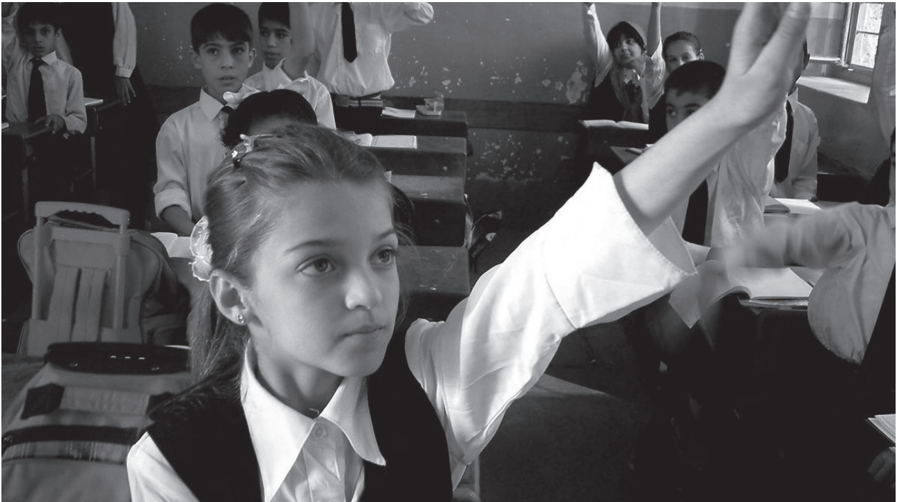
خویندکاریک له بۆلدا - کوردستان

بهرامبەر رهگهزهکهی بهرامبهریان، دوور دهبن. ههلسوکهوتهکان به شتیهیهکی ئاسایی دهکرین و کراوهیی و شهفافی جیگای ترس و شتشاردنهوه دهگرنهوه و نهجامهکهشی مروقی دهروونروون و کراوه دهبیئت.