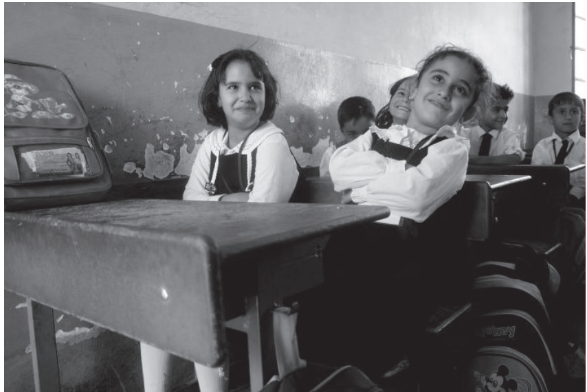
چه‌ند خویندکاریک له‌ پۆلدا - کوردستان

زانست هه‌موو کات له‌ گۆبان و پیش‌که‌وتندایه. له‌ رۆژگاری ئینته‌رنیت و کۆمپیوتەر و گلوبالیزمدا گرنگه‌ ماموستا زوو زوو بنی‌دریته‌ خولی راهی‌زان و زانستیه‌وه بۆ ئه‌وه‌ی بتوانیت له‌ کاره‌که‌یدا نویت‌ترین شیوه‌ی بیرکردنه‌وه و ئاستی زانستی به‌ قوتابییه‌کانی پیش‌که‌ش بکات.