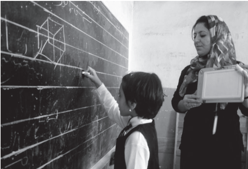
کاتی وانه‌وتنه‌وه له پۆلیکی کوردستاندا