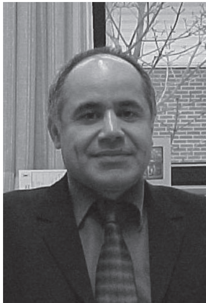
هومەر قهره داغی

ئه رکی ده سه لاته که هه موو مندالیک توانای خویندن هه بیت. دوو بکه ویته وه